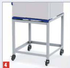
4 Alusraam ratasel