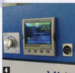
4 Temperatuuri seadistaja ja salvestaja