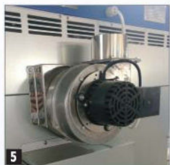
5 Õhu väljalaskeava