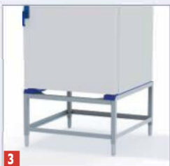
3 Alusraam jalgadel