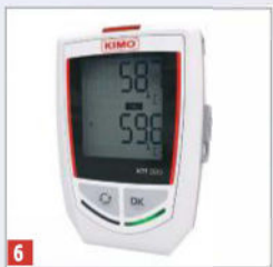
6 Data logger - kahe kanaliga