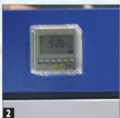
2 Digitaalne nädalaprogrammiga taimer