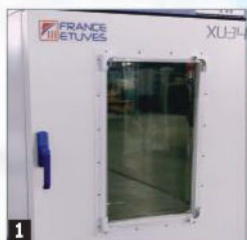
1 Vaatlusaknaga uks