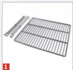
1 Riil juhtsiinidega