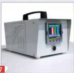
7 Kaasaskantav paberivaba graafiline salvesti