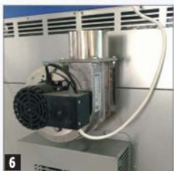
6 Õhkjahutuse väljund õhuava