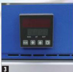
3 Temperatuuri seadistaja