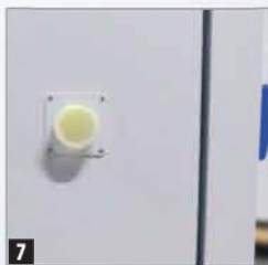
7 Sisendava 60 mm