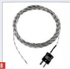
8 Thermocouple andur J 4 või 6 kanalit

1 Vaatlusaknaga uks Selleks et näha ahju sisse.